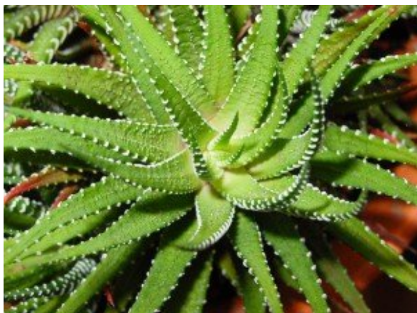
Aloe Vera Pflanze

Das Gel wird speziell für die Heilung von Innen angewandt. Es ist wesentlich konzentrierter, als der bekannte Aloe Vera Saft, denn für seine Herstellung wird ausschließlich das Blattgel der Aloe Vera Pflanze verwendet. Nur jenes besitzt die wichtige, heilende Wirkung, die es ermöglicht viele, verschiedene Beschwerden zu lindern. Anwendungsgebiete