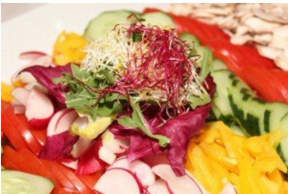
Radieschen im Salat

Die gesundheitlichen Vorteile des Verzehrs von Radieschen sind wirklich beeindruckend. Die positive Wirkung auf Leber, Magen, Nieren und Blase, Lunge, Herz-Kreislaufsystems und des Immunsystems, reinigt das Blut und entgiftet den Körper. Radieschen sind hilfreich in der Behandlung und Prävention von Krebs , Hepatitis, Verstopfung, Infektionen der Harnwege und Nieren-und Hauterkrankungen.