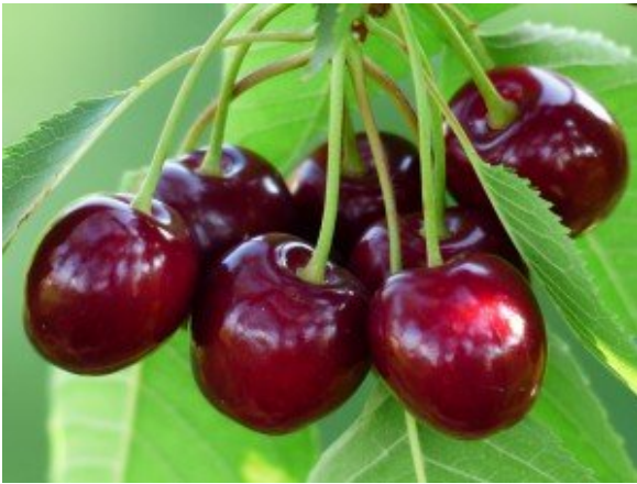
Kirschen am Baum

Aussehen. Nach Einschätzung von Experten sind Kirschen sehr gut für Ihre Gesundheit.